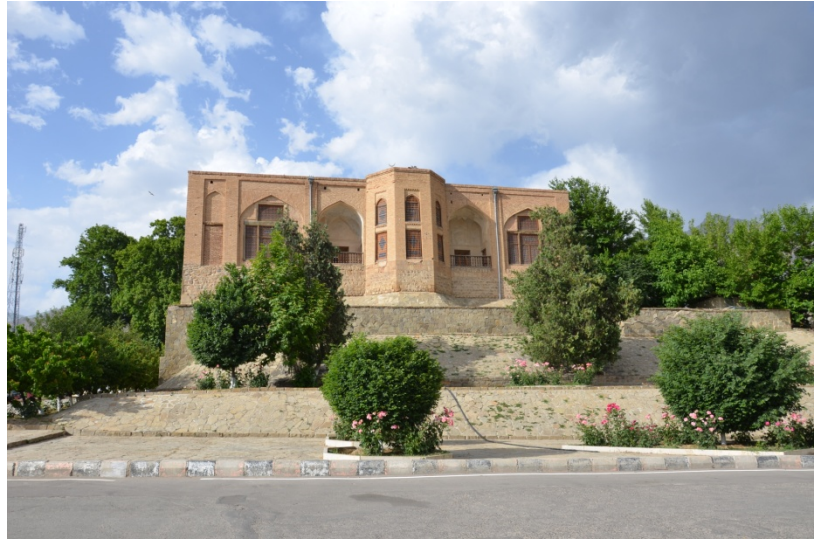
Ordubad Came məscidi