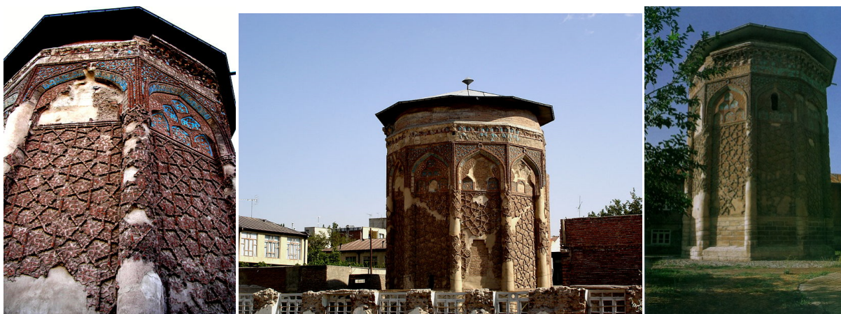
Рисунок 1. Гробница Göy Günübad. 1. Система узора на фасаде 2. Общий обзор гробницы.

Мавзолеем Голубой Гюнбяд – в 1196-м году в городе Марага южного Азербайджана, один из интересных примеров архитектуры, известный как могила матери Хюлаку хана, построена в результате воздействием гробницы Момине Хатун. В отличие от гробницы Момине Хатун, в гробнице Göy Günübad предпочтение отдается декоративности и художественной плотности, верхняя надпись более декоративного типа.