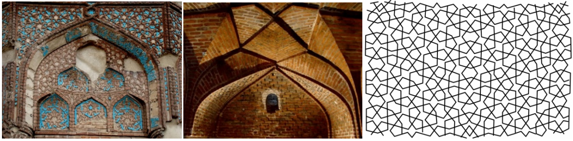
Рисунок 2 . Мавзолей Голубой Гюнбяд

Мавзолей Ахсадан Баба (XIV-XV века) - по аналогии стиля похожа на мавзолей Барда, находится в 50 метрах к востоку от мавзолея Нушаба, построен Ахмед ибн Ейубом. (Рисунок 3)