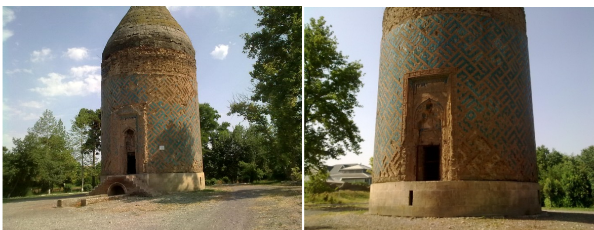
Рисунок 4. Мавзолей Барда

Мавзолей Барда состоит из каменного сидения, цилиндрической оболочки и арки (наружный диаметр 10 м, высота 12,5 м). На оригинальных кирпичных узорах по всей арке многочисленно написано «Аллах» (более 200 раз), стены обычные и на покрыты плитами бирюзового цвета, простым камнем красного цвета по горизонтали и вертикали глазированным камнем. (Рисунок 4)